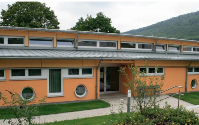
Der Kindergarten in Oberkochen, Baden-Württemberg

Das Kinderhaus in Oberkochen ist in den vergangenen Jahren in mehreren Bauabschnitten kontinuierlich modernisiert und erweitert worden. Das Energiekonzept des Neubaus setzt auf Geothermie in Verbindung mit einer Gas-Absorptionswärmepumpe.