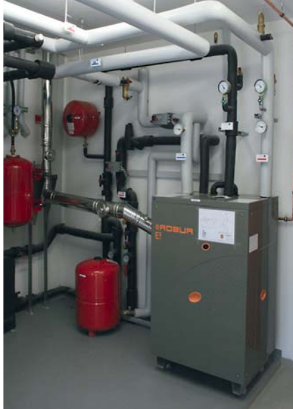
Die Absorptionswärmepumpe für Erdwärme Robur E 3 GS

einen angenehm temperierten Fußboden zum Spielen sorgt. Das beauftragte Planungsbüro entschied sich für eine ROBUR E 3 Systemlösung, einem vorkonfektionierten Gas-Absorptionswärmepumpen-Paket aus hochwertigen Komponenten, die eine kurze Planungsphase ermöglichen und eine hohe Anlageneffizienz garantieren.